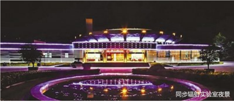
同步辐射实验室夜景

国家同步辐射实验室的任务是围绕国家重大研究计划和战略需求，向国内外用户提供稳定运行的国际一流大科学实验装置，推动和支撑我国在量子功能材料、能源与环境、物质与生命等领域前沿基础研究及应用研究；积极发展同步辐射及测量新技术、新方法，推动我国先进光源关键技术的发展；汇聚与培养一流科学研究与技术发展人才。合肥光源的建设获得国家科技进步一等奖和中国科学院科技进步特等奖，建成以来已经取得大批重要成果。