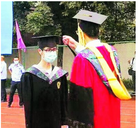
导师为学生扶正流苏