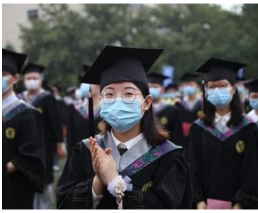
口罩也遮不住的青春笑容与坚毅