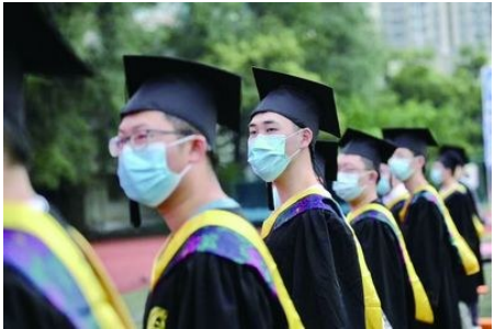
最后一次聆听导师教诲