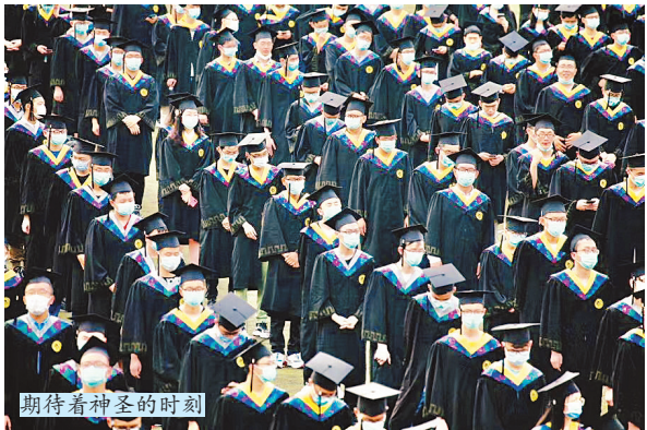
期待着神圣的时刻