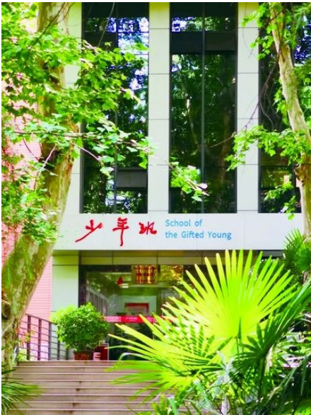
天使路上的少年班学院