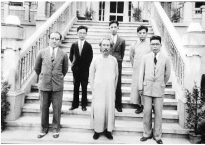
严济慈（前排右1）与李石曾、彭济云、吴学蔺、钟盛标、钱临照（后排左1）合影。

次刊载我国科学家在国内取得的科研成果。截至1935年，严济慈与钱临照合作发表的科学论文有8篇，并在三年内完成了压力对照相乳胶的感光作用之研究、水晶圆柱体在扭力下产生电荷及其振荡的研究等两个课题。由此，严济慈被钱临照视为对自己一生有重要影响的三位老师之首，而严济慈心无旁骛的科研精神，也为钱临照毕生传承践行。