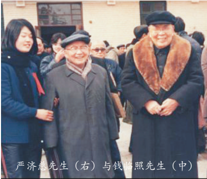
严济慈先生（右）与钱临照先生（中）

“蜡炬精神在，桃李天下知”，这是钱临照先生在追忆恩师严济慈时写下的句子。 钱临照是中国著名物理学家、教育家，中国金属晶体范性形变、晶体缺陷与物理学史等领域研究的奠基人之一，在大同大学就读期间师从著名物理学家严济慈先生。师生二人均为我国科学界的领军人物，他们一生追求真理，热爱祖国，相携而行，在我国科研教育事业发展中共同书写下璀璨华章，也彰显出他们之间真挚的师生情谊。