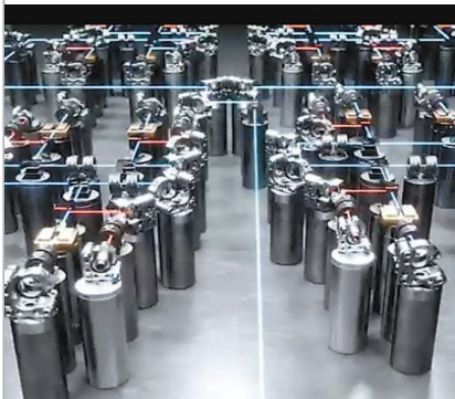
构建量子计算原型机“九章三号” 刷新光量子信息技术世界纪录

日前，《人民日报》发布 2023 年重大科技成就，我校主持的两项成果“构建量子计算原型机“九章三号”刷新光量子信息技术世界纪录”“墨子巡天望远镜正式投入观测 全球光学时域巡天能力最强设备”，以及合作的一项成果“‘拉索’完整记录‘宇宙烟花’爆发全过程 精确测量迄今最亮伽马暴的高能辐射能谱”三项成果入选。