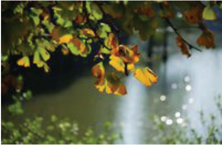
秋叶媚，秋蝉鸣。毕竟将尽，生命的华美绝响。