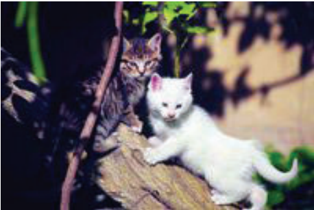
秋日暖，更暖的，是你的陪伴。