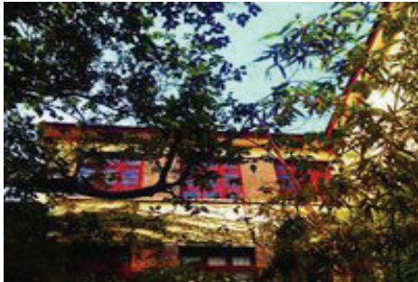
叶疏了，秋抚着老窗，瞥一眼人间。