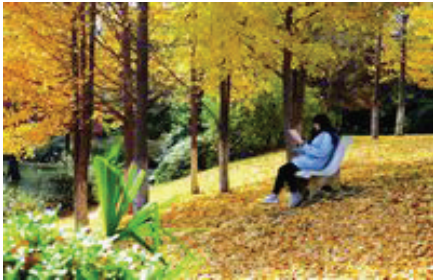
午窗几度惊梦残，书声阵阵透晚秋。