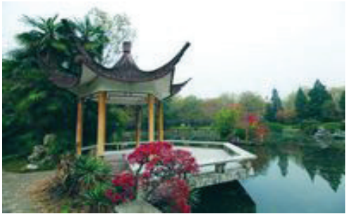
何妨，烹蟹煮酒采秋菊，且聚画亭唱西风？