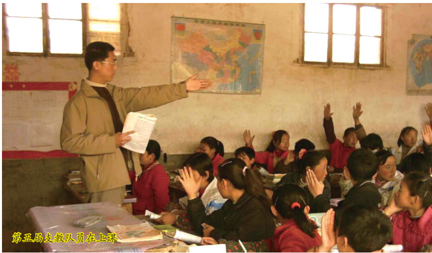
第五届支教队员在上課

学雷锋志愿服务“四个 100”先进典型活动旨在宣传推选全国 100 个最美志愿者、100 个最佳志愿服务组织、100 个最佳志愿服务项目和 100 个最美志愿服务社区。该活动通过组织择优推选、社会公众投票、专家评审等严格规范的评选程序,从中选树符合条件的先进典型,促进学雷锋活动常态化,实现全社会学雷锋志愿服务水平的整体提升(校团委)